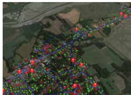
Analyse des besoins en eau